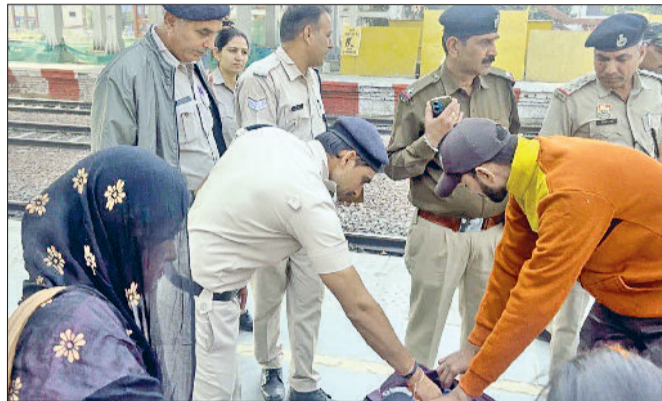
रेलवे स्टेशन पर अभियान के दौरान जांच करते हुए पुलिस कर्मी।