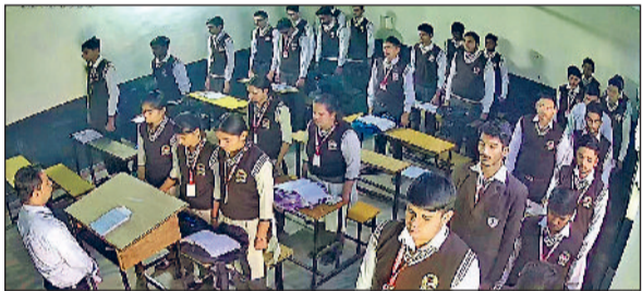
गोहाना। निर्दोष मृतकों को श्रद्धांजलि देते हुए जेएनएन विद्यालय के शिक्षक और विद्यार्थी।