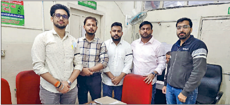
सोनीपत। काले बिल्ले लगाकर विरोध करते हुए चिकित्सक।