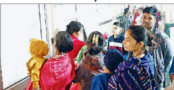
नागरिक अस्पताल में ओपीडी के बाहर लगी मरीजों की भीड़।

शहर में लगातार बढ़ते वायु प्रदूषण और बदलते मौसम का असर अब बच्चों की सेहत पर गंभीर रूप से दिखाई देने लगा है। नागरिक अस्पताल के शिशु रोग विभाग की ओपीडी में पिछले 15 दिनों के भीतर मरीजों की संख्या में करीब 60 प्रतिशत की बढ़ोतरी दर्ज की गई है। सुबह से ही अस्पताल में इलाज के लिए आए बच्चों और उनके अभिभावकों की लंबी कतारें लग रही हैं। अस्पताल में जहां पहले रोजाना औसतन 140 से 150 बच्चे ओपीडी